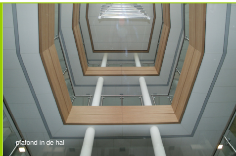
plafond in de hal